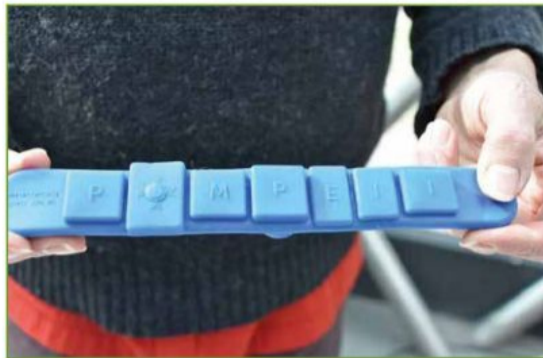
Fig. 7 - Prototipo del braccialetto CON-ME

braccialetto indossabile grazie alla collaborazione tra aziende. Il dispositivo di geo-referenziazione comprende diverse tecnologie che consentono di avere un elevato grado di libertà nella scelta delle modalità di interazione, come di seguito elencati: dispositivo di avvio e di stop automatico, bottone di SOS, modulo GPS, modulo Wi-Fi, modulo Bluetooth, batteria integrata, LED di segnalazione della carica della batteria, modulo per la ricarica wireless (Fig. 8)