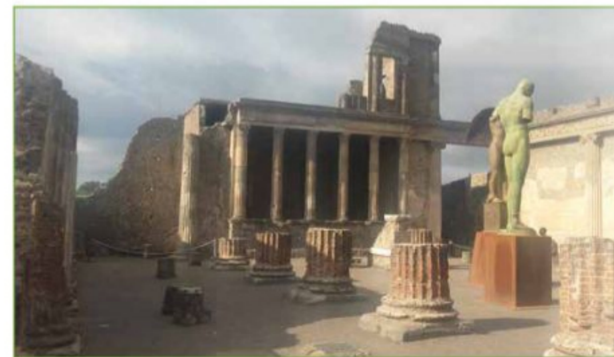
Fig.1 -Parco Archeologico di Pompei - Basilica (Regio VIII)

programmatico basato sulle tecnologie integrate e innovative (IoT - Internet of Things /internet delle cose) Numerosi sono stati gli investimenti effettuati e le attività svolte negli ultimi anni dal MiBAT nell'ambito del Grande Progetto Pompei d'intesa con il Parco Archeologico di Pompei e con l'Arma dei Carabinieri. Il parco Archeologico di Pompei è dotato di data center, copertura WI-FI dell'intero sito, di un nuovo sistema di videosorveglianza IP, piano della conoscenza, nuovo impianto di illuminazione perimetrale a led, sistema informativo geografico (GIS), copertura con rete Tetra dell'intero sito, nuova connessione internet a fibra ottica per gli utenti, piattaforma per la gestione ed erogazione delle app (Fig. 3). Va evidenziato, inoltre, che si sono svolte, e continueranno a svolgersi, attività di monitoraggio focalizzate alla prevenzione e protezione del sito in collaborazione con grandi aziende, Enti di Ricerca, Università e Istituzioni di Governo quali: servizi a bassa invasività per il monitoraggio dei movimenti e delle deformazioni del terreno e delle strutture; monitoraggio satellitare interferometrico con analisi dei dati storici e dei fenomeni lenti mediante i rilievi della costellazione satellitare COSMO-SkyMed ; rilevazio-