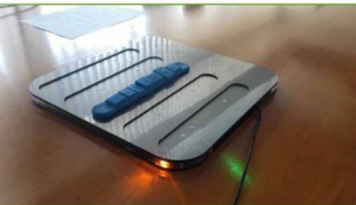
Fig. 8 - Il braccialetto CON-ME in carica

Il dimostratore tecnologico integrato innovativo in corso di realizzazione presso il Parco Archeologico di Pompei può rappresentare il modello da seguire a livello nazionale, e non solo, per la gestione della sicurezza delle persone e dei monumenti sia in condizioni normali sia in condizioni di emergenza.