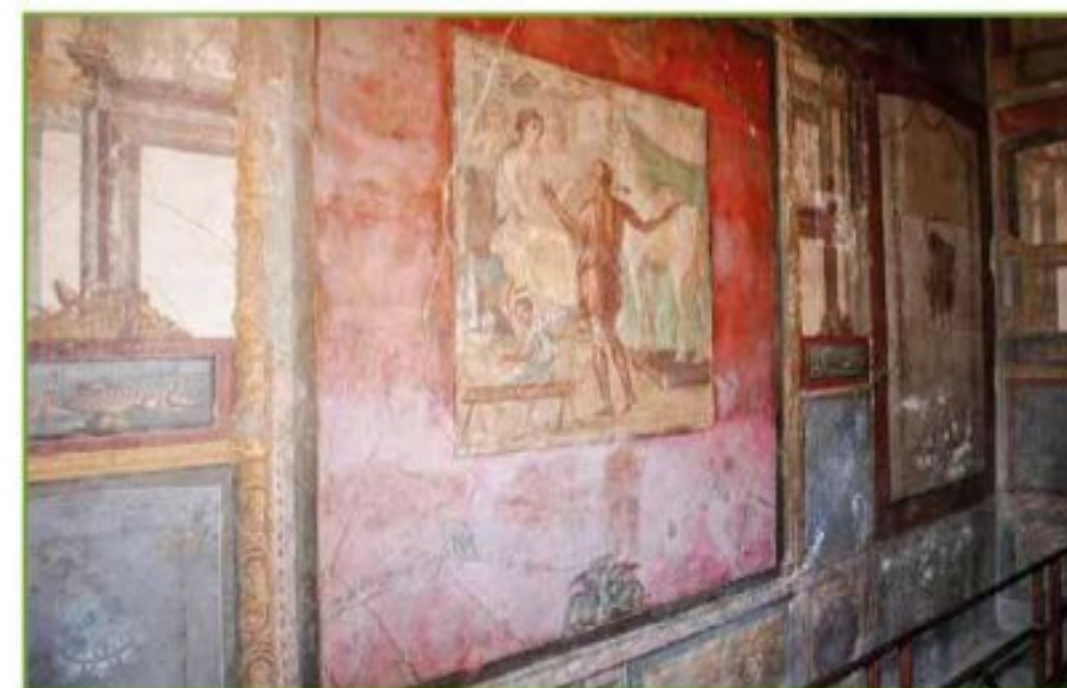
Fig. 10 - Parco Archeologico di Pompei - Domus dei Vettii (Regio VI).