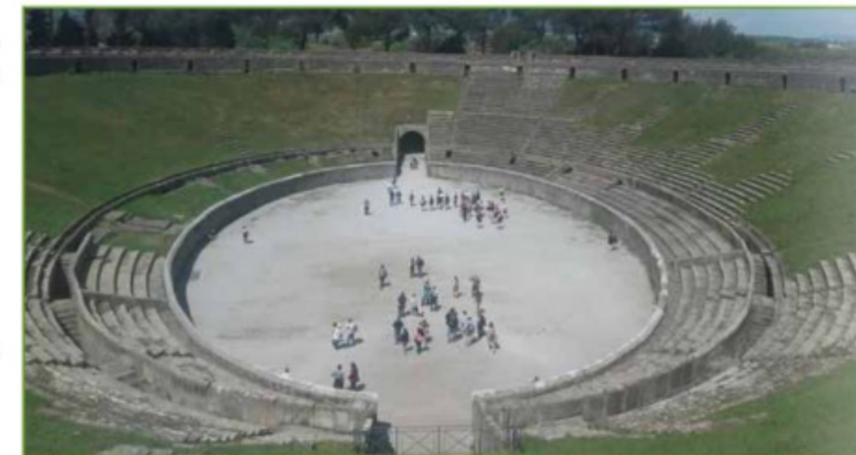
Fig. 6 - Parco Archeologico di Pompei - Anfiteatro (Regio II).

Le operazioni previste consistono nella comprensione dei messaggi inviati dai dispositivi indossati dai visitatori e la conseguente visualizzazione della loro dislocazione in una mappa per un supporto alle decisioni degli operatori. Per la soluzione di geo-referenziazione del Visitatore all'interno del parco archeologico di Pompei, è stata creata una rete sensori denominata "CON-ME", in cui vengono impiegati sia una rete WLAN di Access Point e sia componenti ingegnerizzati in un