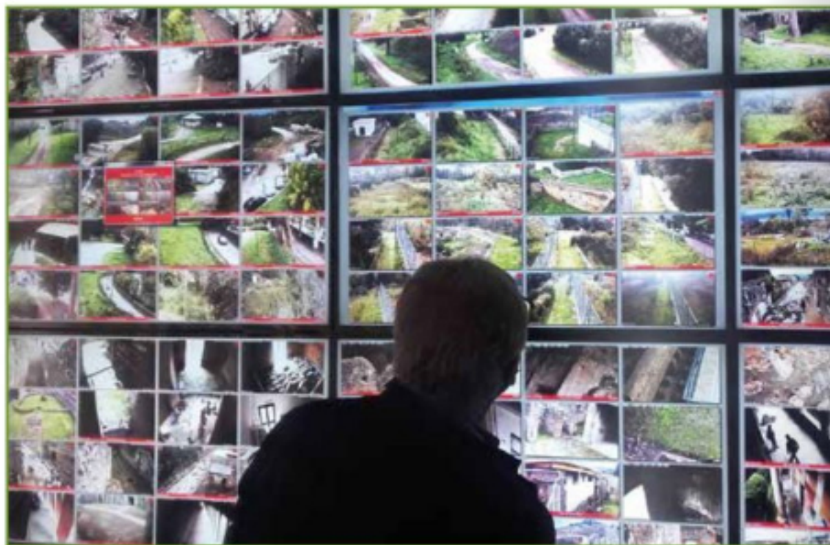
Fig. 2 - Parco Archeologico di Pompei - Sala controllo.

L'obiettivo principale del progetto Smart@POMPEI è quello di realizzare un modello tecnologico integrato replicabile, modulabile, flessibile, basato sull'utilizzo delle tecnologie IoT (Fig.4). La dorsale principale del sistema tecnologico integrato è rappre-