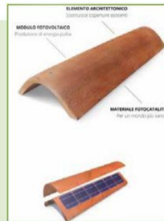
Fig. 9 - Coppi fotovoltaici

avvicinare i giovani alle nuove tecnologie utilizzate nell'ambito di Smart@POMPEI al fine di generare una consapevolezza digitale avanzata utile per entrare nel mondo del lavoro e colmando, ove esiste, la carenza generalizzata di competenze digitali di base. Sono previste, inoltre, azioni finalizzate a riaffermare e rafforzare il concetto di legalità e al miglioramento della sua percezione da parte della comunità locale.