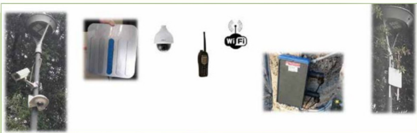
Fig. 3 - Dispositivi e sensori.

Tanto maggiore è la velocità di commutazione, tanto migliore sarà la velocità di trasmissione dell'informazione.